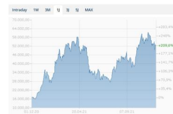
Chart - Bitcoin - Schweizer Franken