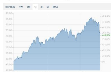
Ölpreis (Brent) Chart in USD - 1 Jahr

Der Goldpreis hat sich im November volatil seitwärts bewegt. In Inflationsphasen und bei Unsicherheiten sollte Gold eigentlich weiter steigen. Eine mögliche Erklärung: Der jüngste Preisrückgang könnte mit der Antizipation der Investoren zusammenhängen, dass tiefe Realzinsenphasen historisch nie lange anhalten und der Goldpreis früher oder später korrigiert.