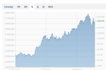
Goldpreis Chart in USD - 1 Jahr

Im November zeigte der Ölpreis eine Seitwärtsbewegung. Die OPEC+ hat eine mögliche Erhöhung der Fördermengen aufgrund des niedrigen Preisniveaus und der schwachen Nachfrage mehrfach verschoben. Solange der Brent-Preis unter 75 USD pro Barrel bleibt, dürfte eine Erhöhung der Fördermengen weiterhin ausgesetzt bleiben. Trotz dieser Zurückhaltung könnten Rohstoffe insgesamt durch die erwarteten und angekündigten Zinssenkungen wichtiger Zentralbanken Unterstützung erfahren. Rohstoffe bieten als Anlageklasse in Zeiten niedrigerer Zinsen eine attraktive Möglichkeit für Investoren und haben historisch in Phasen von Zinssenkungen tendenziell profitiert. Dies könnte auch für das Gold gelten, wo der Preis nach einer Boomphase zuletzt etwas zurück korrigierte.