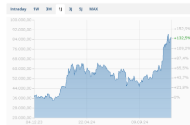
Chart - Bitcoin - Schweizer Franken