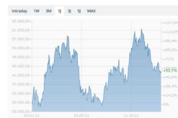
Chart - Bitcoin - Schweizer Franken