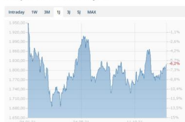
Goldpreis Chart in USD - 1 Jahr

Der Goldpreis konnte zum Jahresende 2021 die Marke von 1'800 USD pro Unze überschreiten. Die anhaltenden Nachrichten über hohen Inflationszahlen und die Nachfrage nach Schmuck, physischem Gold sowie Goldkäufe der Notenbanken sollten den Preis stützen. Andererseits belasten die erwarteten Zinserhöhungen in den USA und weiterer Länder.