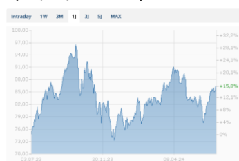
Ölpreis (Brent) Chart in USD - 1 Jahr

Der Rohölpreis hat über die letzten vier Wochen volatil zugelegt. Hauptgründe dafür sind die besser als erwartete Nachfrage aus dem Transportsektor und die gestiegenen Spannungen zwischen dem Libanon und Israel. Die Hisbollah-Miliz greift vermehrt mit Drohnen Israel an, was zu häufigeren Genschlägen führt. Inzwischen denkt Israel darüber nach, sogar eine Bodenoffensive im Libanon zu starten. Dies wäre eine weitere Eskalation, was die Erdölpreise treiben dürfte. Die Edelmetallpreise entwickelten sich im letzten Monat durchschnittlich leicht rückwärts (Gewinnmitnahmen beim Silber). Wie erwartet ist die zusätzliche Goldnachfrage aufgrund der Fussball EM inzwischen eingepreist. Die Goldkäufe wichtiger Zentralbanken bieten aber immer noch eine gute Unterstützung.