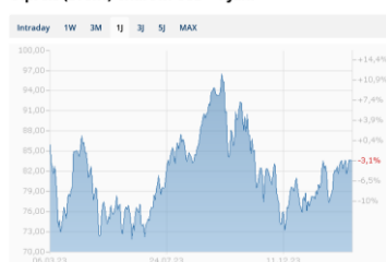
Ölpreis (Brent) Chart in USD - 1 Jahr

Der Rohölpreis legte über die letzten vier Wochen wieder zu. Die Förderkürzungen seitens der OPEC+ werden mehrheitlich durch die konjunkturbedingte schwache Nachfrage kompensiert. Aber auch die Produktionserhöhungen in den USA und Brasilien helfen, die Förderkürzungen abzufedern. Aufgrund der unveränderten geopolitischen Risiken dürfte die Volatilität beim Rohölpreis hoch bleiben. Die Edelmetallpreise sind mehrheitlich gefallen und widerspiegeln die globalen Wachstumsorgen. Nur der Goldpreis konnte im Februar in Antizipation der erwarteten Zinssenkungen der Fed zulegen und damit seinem Status als "sicherer Hafen" in unsicheren Zeiten gerecht werden. Gold bleibt seinem Ruf als gute Diversifikationsalternative somit gerecht.