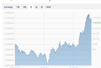
Goldpreis Chart in USD - 1 Jahr

Der Goldpreis legte über die letzten vier Wochen weiter zu und wurde seinem Ruf als "sicherer Hafen" gerecht. Mittlerweile dürften die verzögerten Zinssenkungsschritte, Goldkäufe wichtiger Zentralbanken (z. B. China und Indien) und die zusätzliche Nachfrage aufgrund der Fussball EM eingepreist sein.