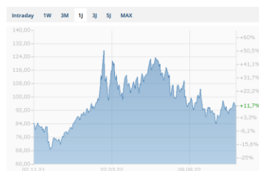
Ölpreis (Brent) Chart in USD - 1 Jahr

Die Notierungen der Edelmetallpreise sind über die letzten 4 Wochen mehrheitlich positiv ausgefallen. Ausnahme Palladium, welches in Autokatalysatoren verwendet wird, da die Fahrzeugproduktion ins Stocken geriet. Zudem wird der Rohstoff vermehrt durch das günstigere Platin ersetzt.