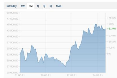
Chart - Bitcoin - Schweizer Franken