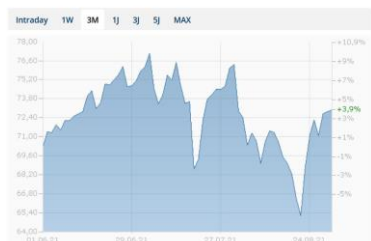
Ölpreis (Brent) Chart in USD - 3 Monate

Der Goldpreis fiel zum Augustbeginn vor allem wegen dem starken USD und konnte sich danach wieder erholen. Die Erholungsgründe sind unverändert. Die Gründe sind weitere Meldungen über eine relativ hohe Inflation, die positive Nachfrageprognose nach Schmuck sowie Münzen/Barren als auch die erwarteten Gold-Käufe der Notenbanken. Bisher wurde das Gold seinem Ruf als Inflationsschutz nicht gerecht.